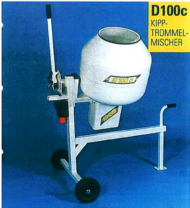
D100c KIPP- TROMMEL- MISCHER