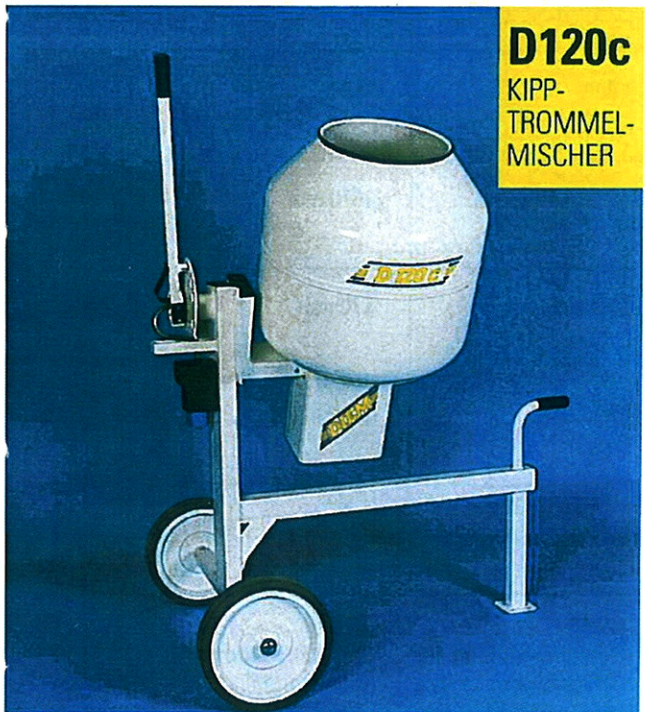
D120c KIPP- TROMMEL- MISCHER